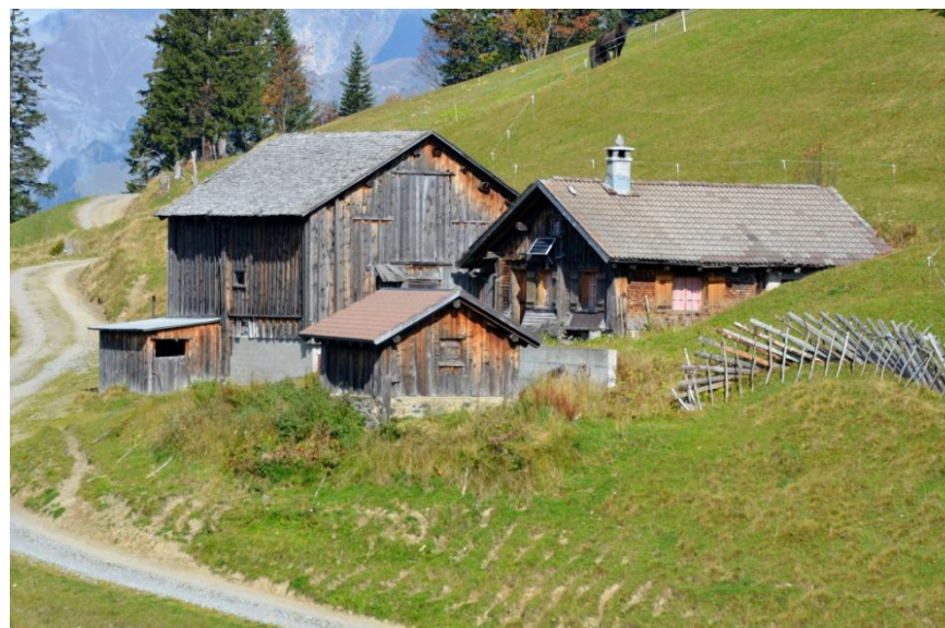
Bestehende Alpgebäude Alp Wiesli

Der Verein Alp Wiesli Furna möchte diese Alpgebäude für Gäste zum Begegnungs- und Verpflegungsort mit Übernachtungsmöglichkeit umnutzen und so ganzjährig «neues Leben» auf den Furner Berg bringen.