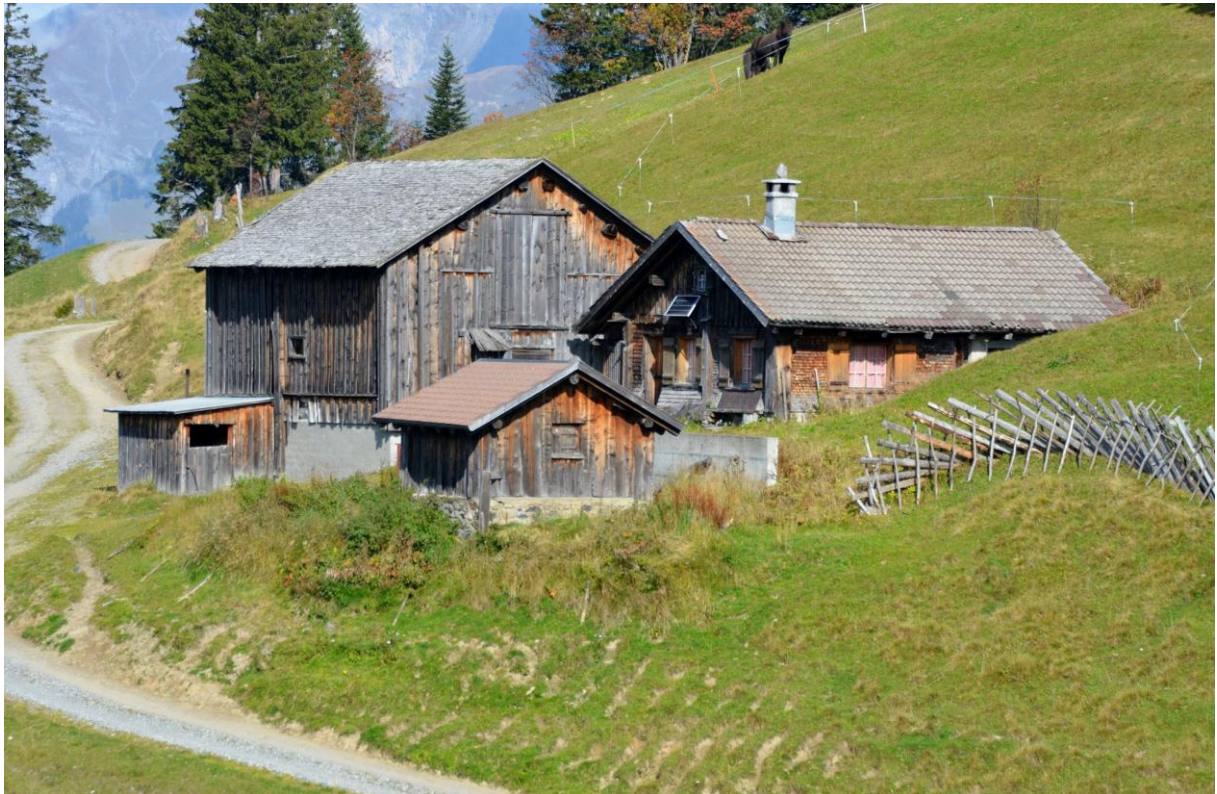
Bestehende Alpgebäude Wiesli, Furna